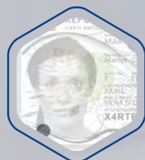
Effet mat et brillant sur le portrait