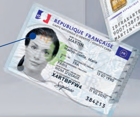
Effet visuel et tactile